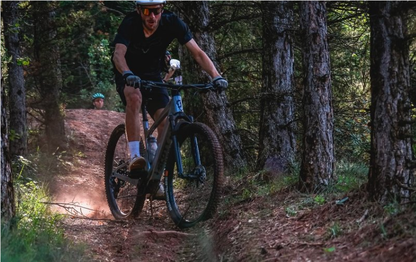
La forêt de St Thomas (V.Govignon)