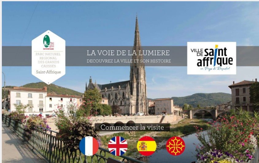
La voie de la Lumière - Saint-Affrique