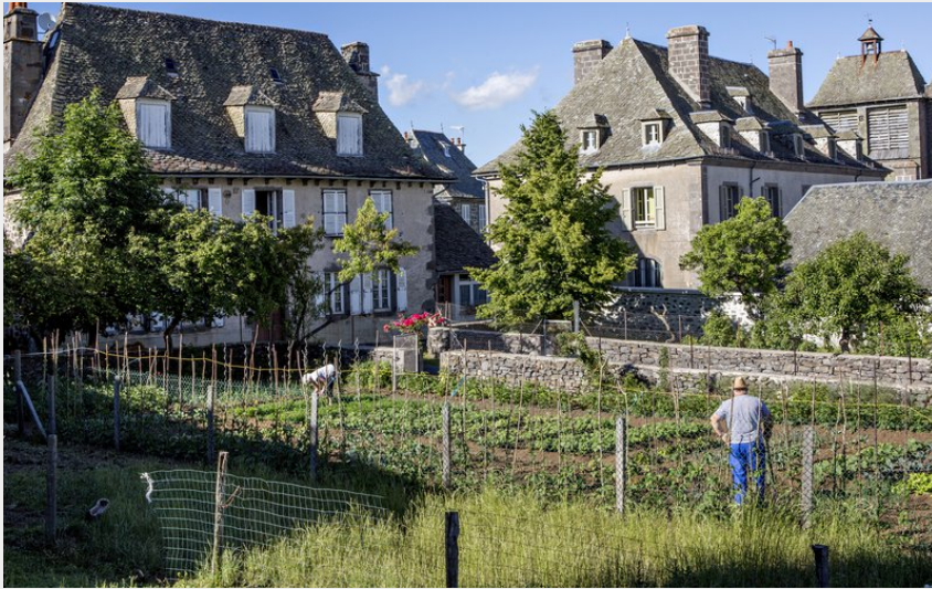
Le village de Thérondeles (P. Soissons)