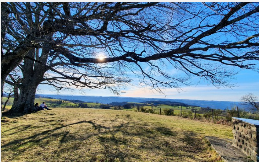
Vue à 360°C au Puy de Montabès