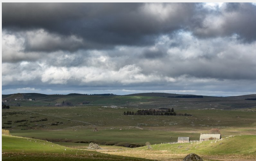
Le Haut-plateau de l'Aubrac avec ses bandes boisées