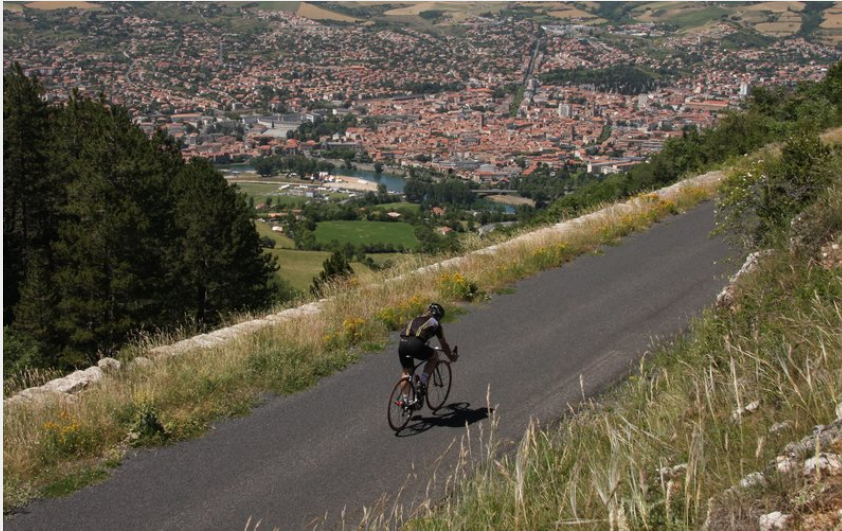
Vue depuis le col du renard