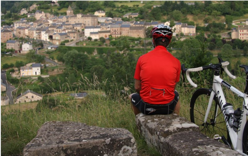
Château de saint Beauzély