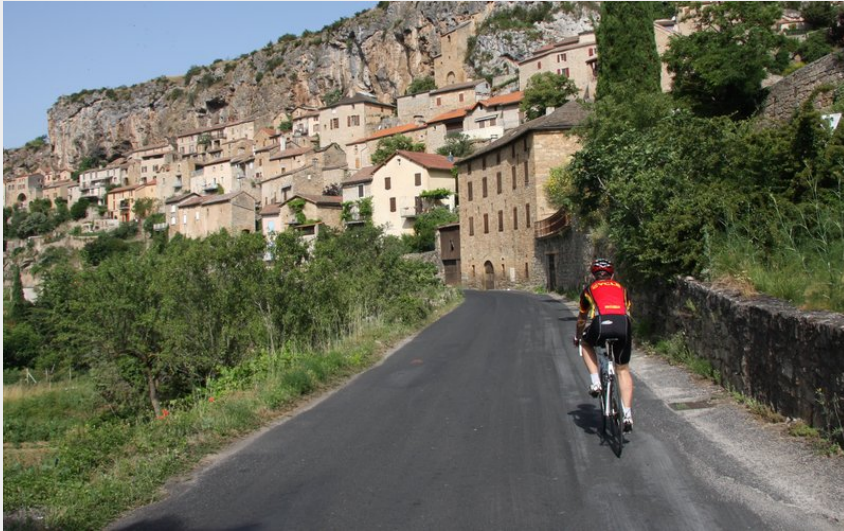
Sur la route de Peyre