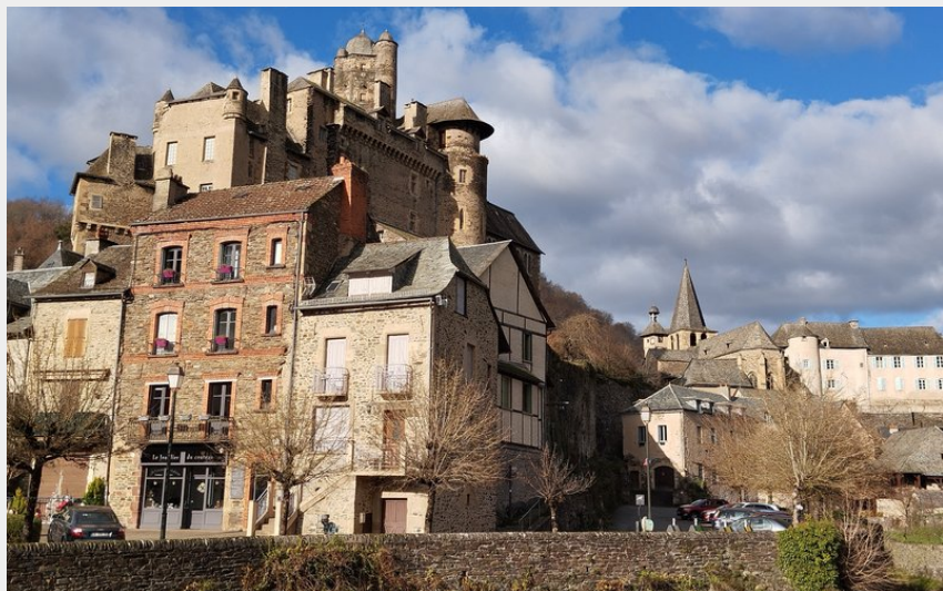
Le château d'Estaing