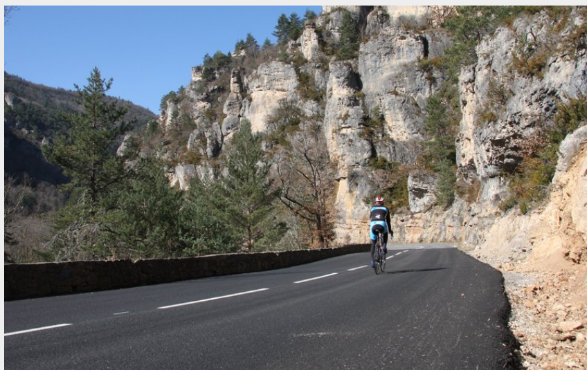
Gorges de la Jonte (@Y.Blanc)