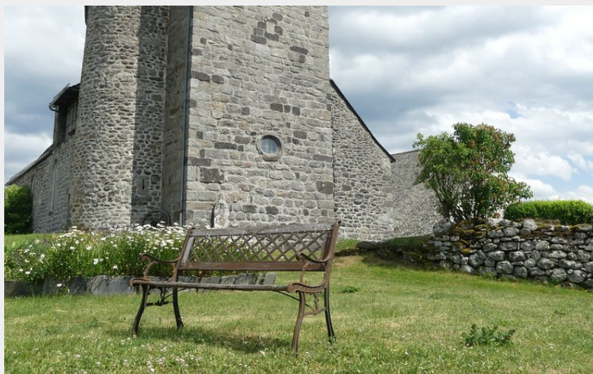
L'église de Vitrac