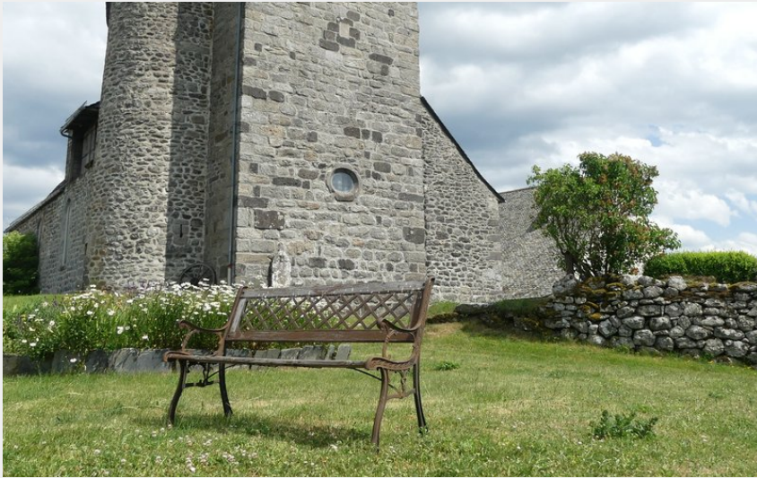
L'église de Vitrac