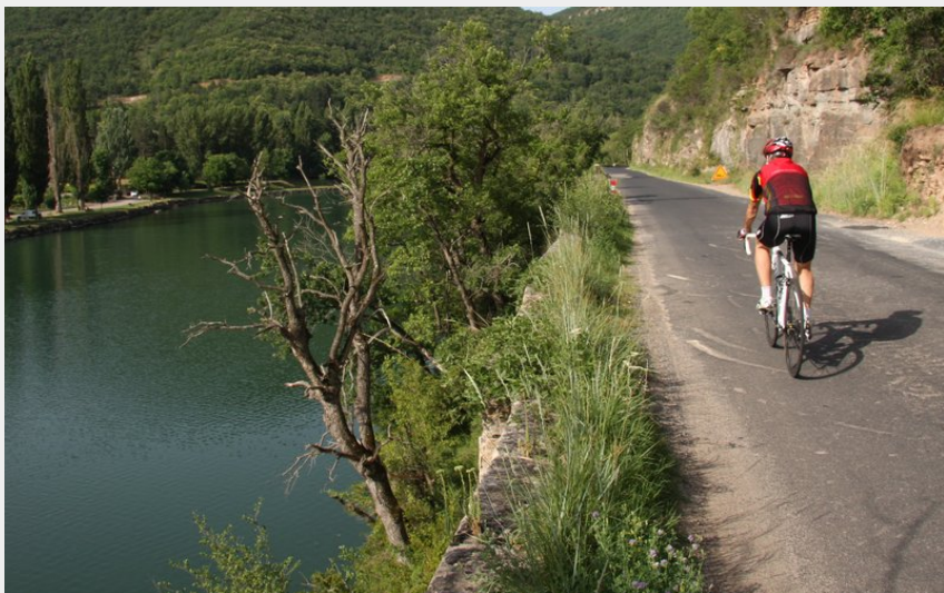
Les berges du Tarn