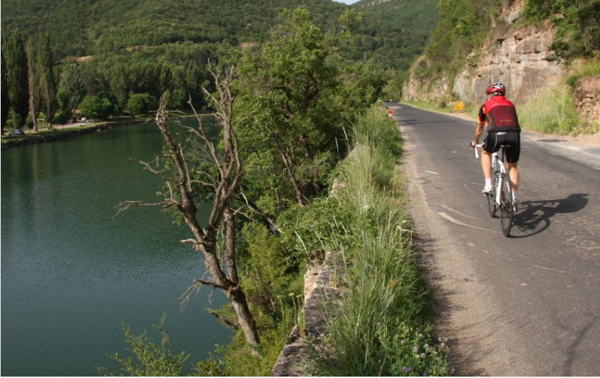
Les berges du Tarn