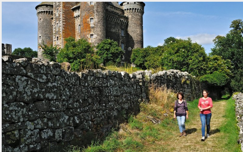
Le Château du Bousquet, monument historique du XIV ème siècle