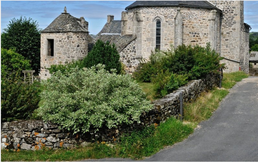
Eglise XVème siècle de Soulages-Bonneval