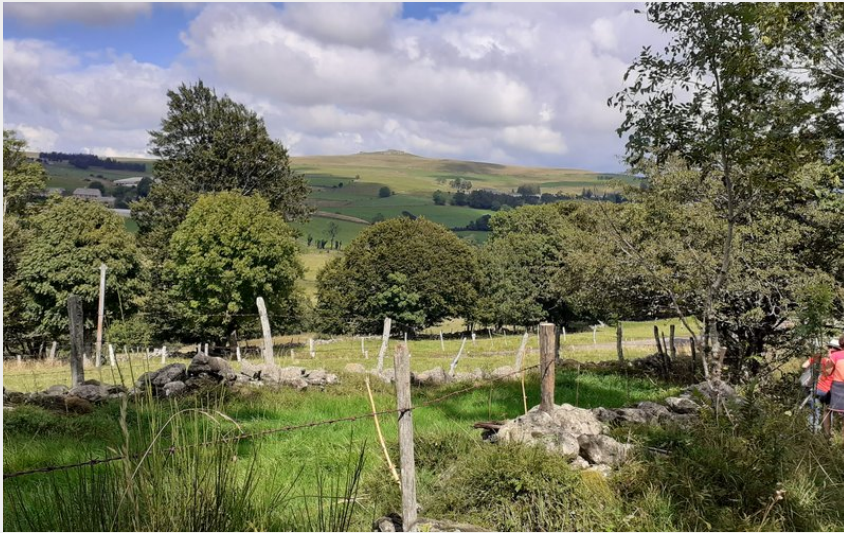
Point de vue Roc du Cayla (Tourisme en Aubrac)