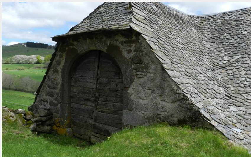
Grange traditionnelle et son toit de lauze