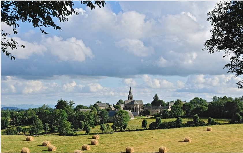
Vue sur Condom d'Aubrac