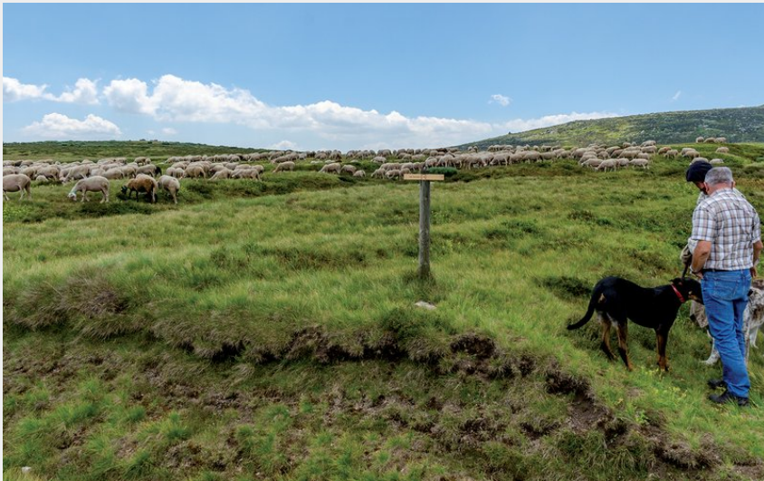
Transhumance Mont Lozère (cabane de Mas Camargue)