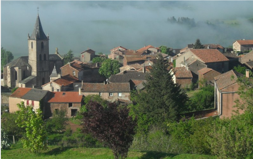
Village de Rebourguil (LaureBarthelemy)