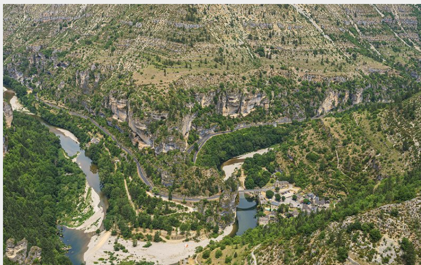
Virage St-Chély-du-Tarn