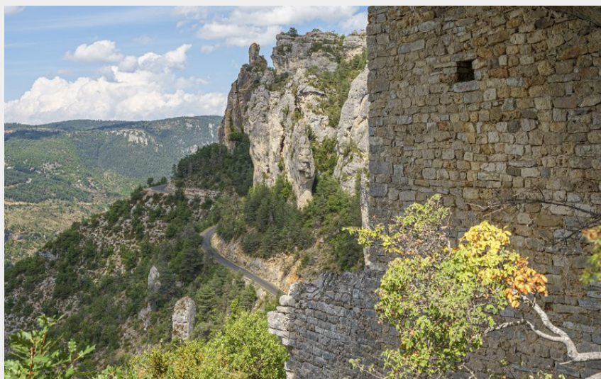
Les Vignes