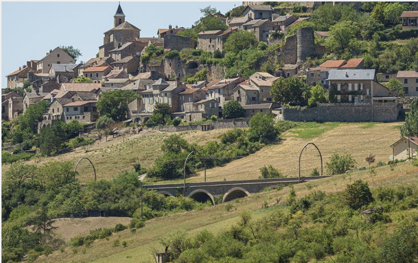
Compeyre - ©Exo Dams