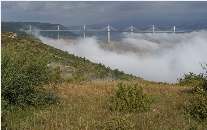
Viaduc depuis Brunas