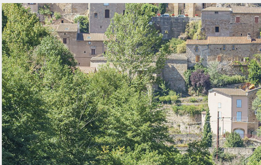
Bateliers village de Peyre