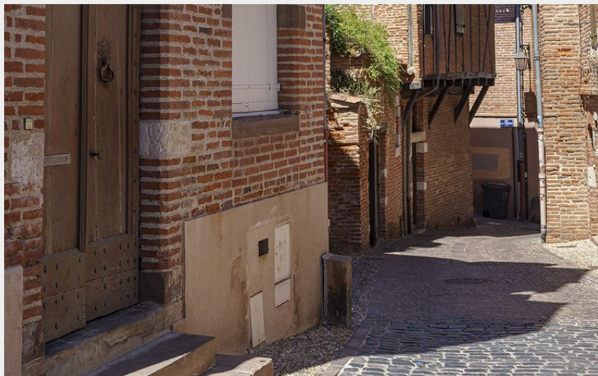
Albi Sainte-Cécile