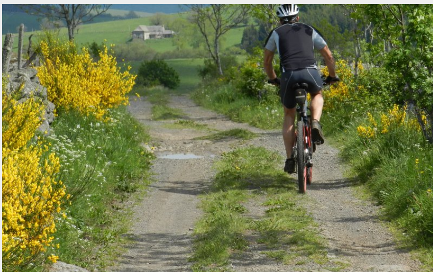
le petit tour du Bouyssou (Tourisme en Aubrac)