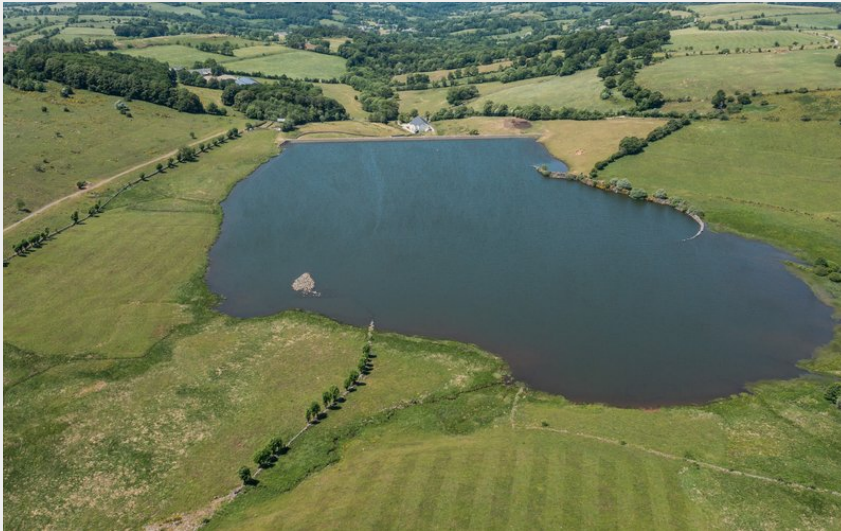
Le Lac des Chèvres (AAPPMA)