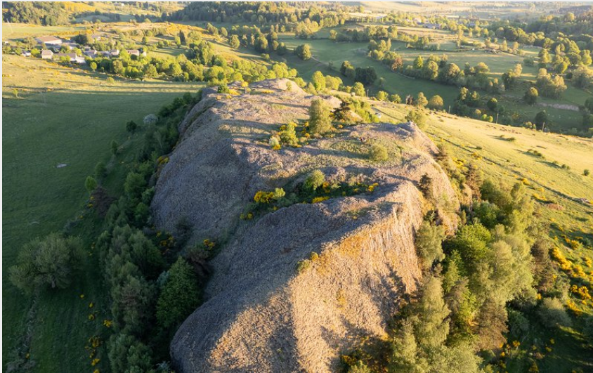
(B. Colomb - Lozere Sauvage pour PACT Aubrac)