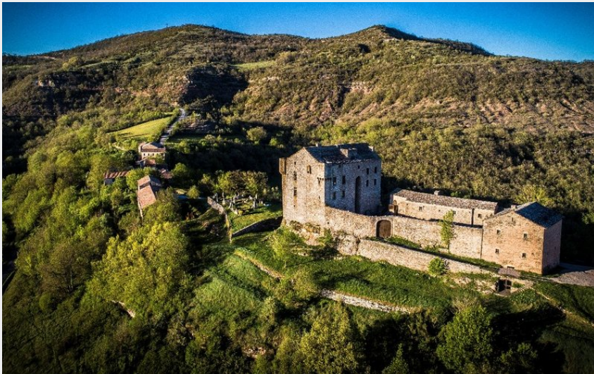
Château de Montaigut (Stelloweb)