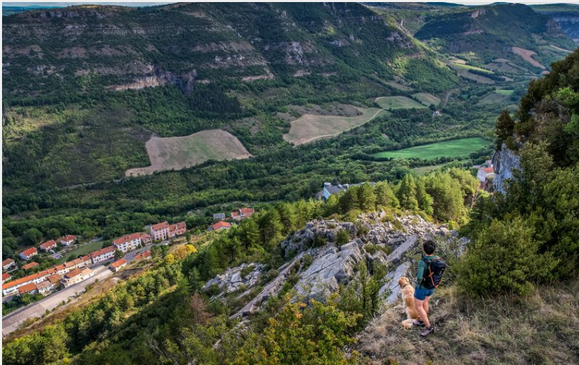
Les éboulis du Combalou