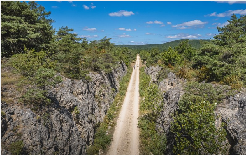
Sur l'ancienne voie ferrée