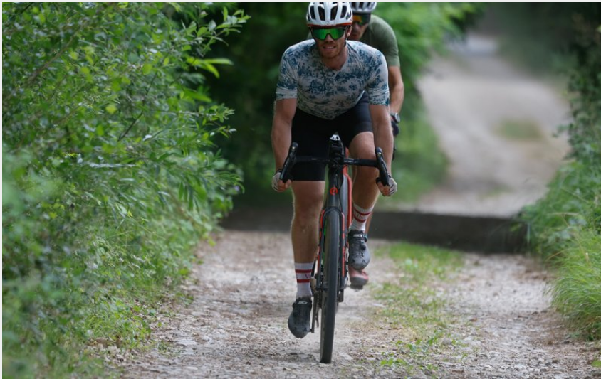
Piste longeant la Dourbie