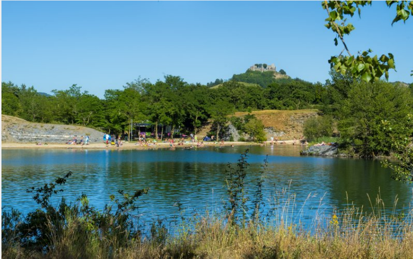
Plage de la Cisba (Florent Deltort)