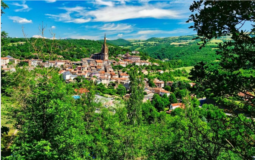
Vue sur Belmont (M.Obst)