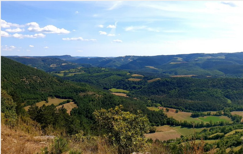
Crêtes et buissière du plateau de Mascourbe