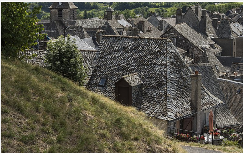
Les toits de lauzes de Mur-de-Barrez