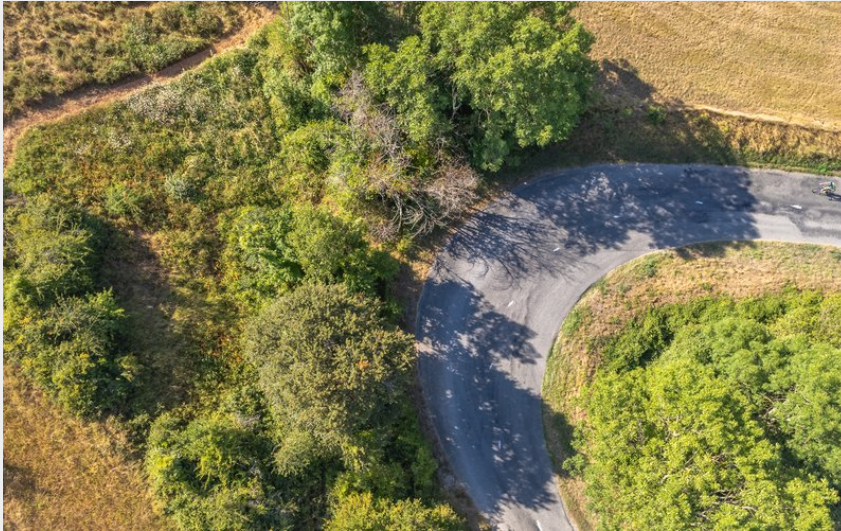
Au détour d'un lacet