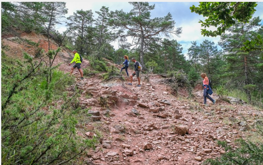
Les terres rouges