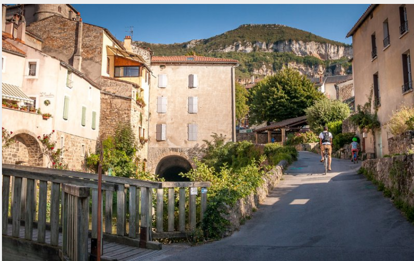
Ancien village de Creissels