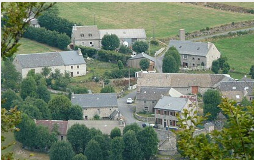
Village de Saint-Laurent-de-Veyrès