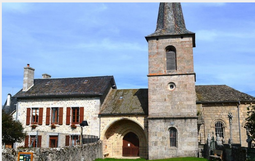
L'église d'Anterrieux avec le musée de la Résistance