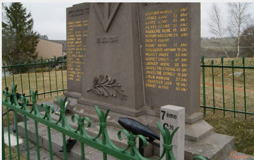
Monument aux morts de la Résistance