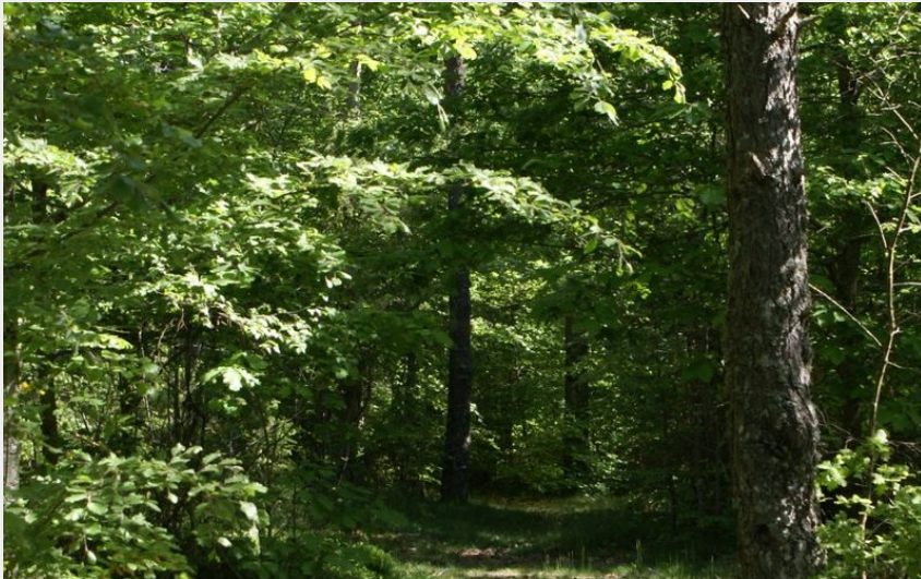
Sentier boisée en bord de Tourbière (@OT Pays de Saint-Flour)