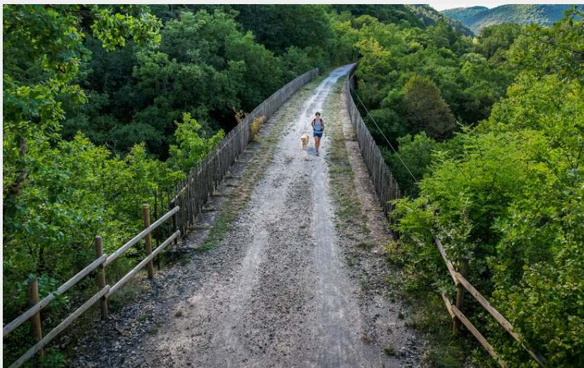
Voie verte (Virginie Govignon)