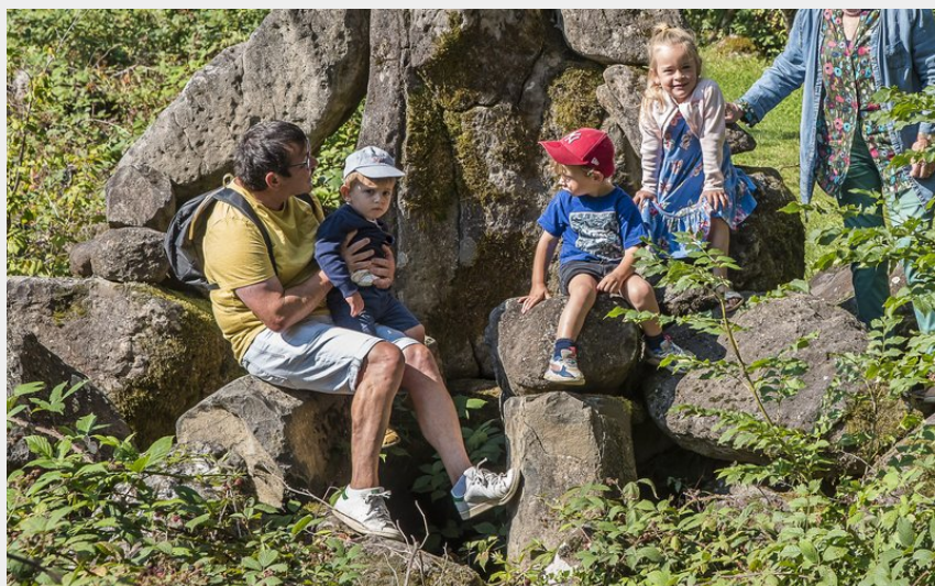
Le géant de la coulée de lave