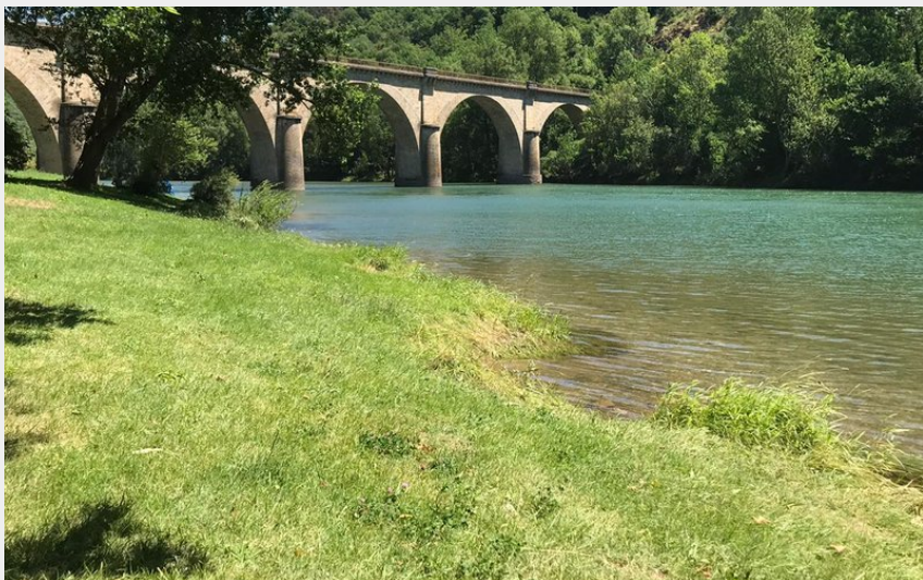
Le pont de Lincou