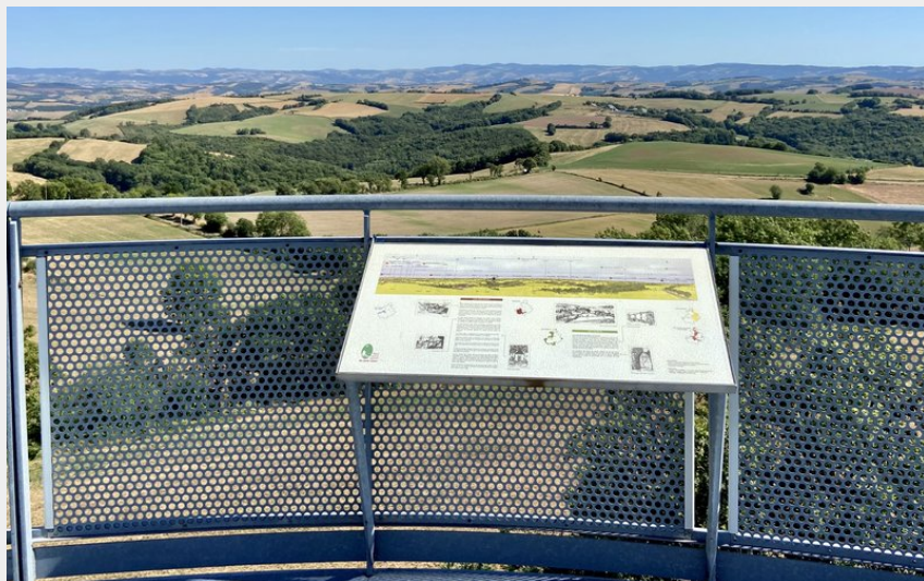
Belvédère Montclar