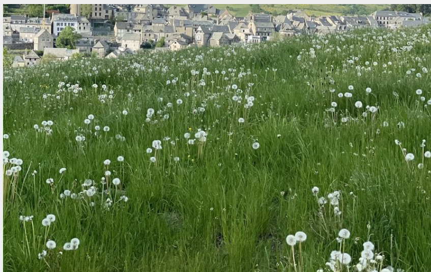
Vue sur Laguiole depuis le Puech (Aurore Jonckheere)